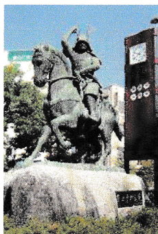
真田幸村像 上田駅前