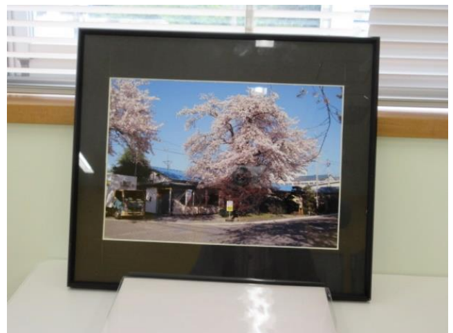
大活躍してくれた旧事務所（写真転写）