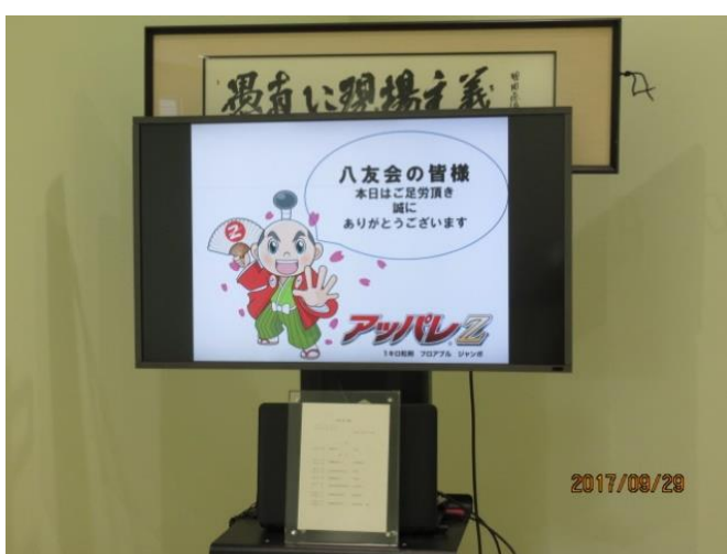
階段を上った正面にある歓迎のプロジェクター