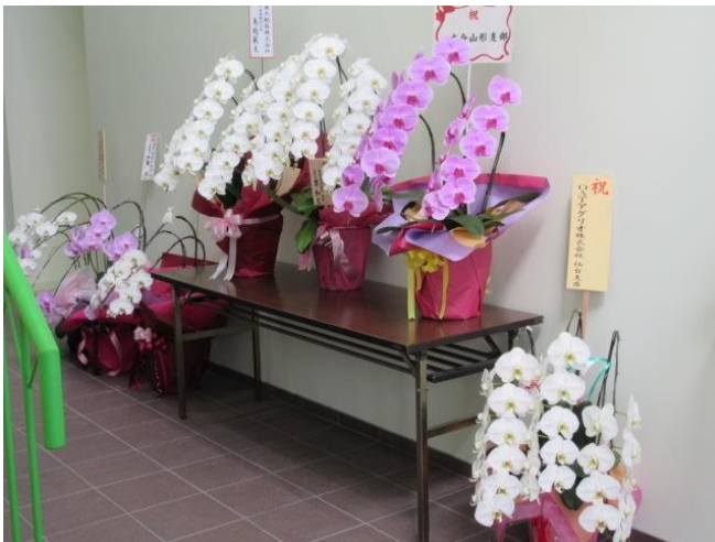
落成式（9/14）お祝いの胡蝶蘭 講堂 中央のピンク色が八友会山形支部寄贈