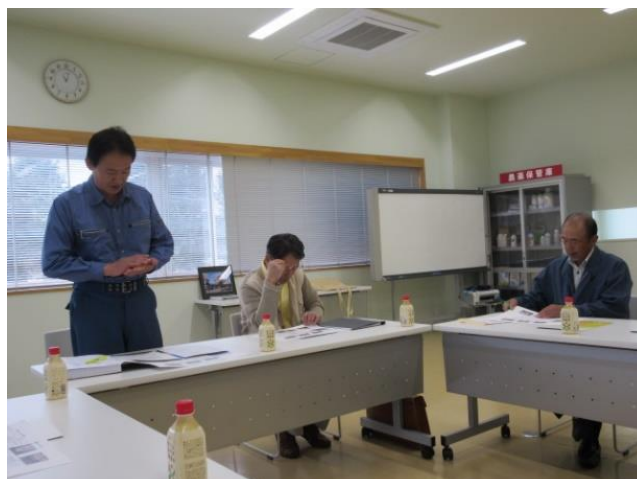
海沼工場長よりレクチャーを頂く