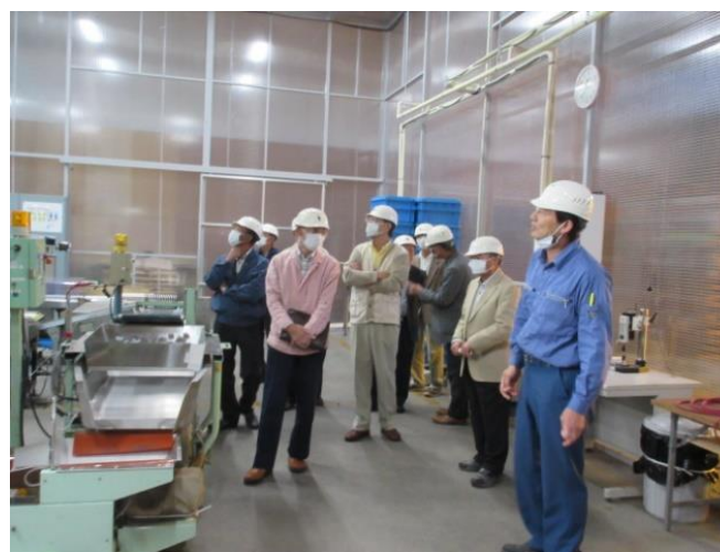
粒剤包装の見学バッチリ粒剤 10kg袋詰め作業中