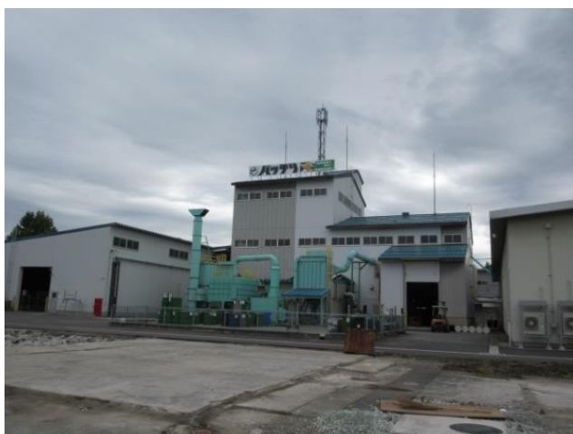
全国へ飛翔：バッチリ製造工場 （旧建物は解体され更地となっている）