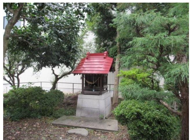
今後も見守ってくれる『八洲神社』 （八洲グループは永遠に不滅です）